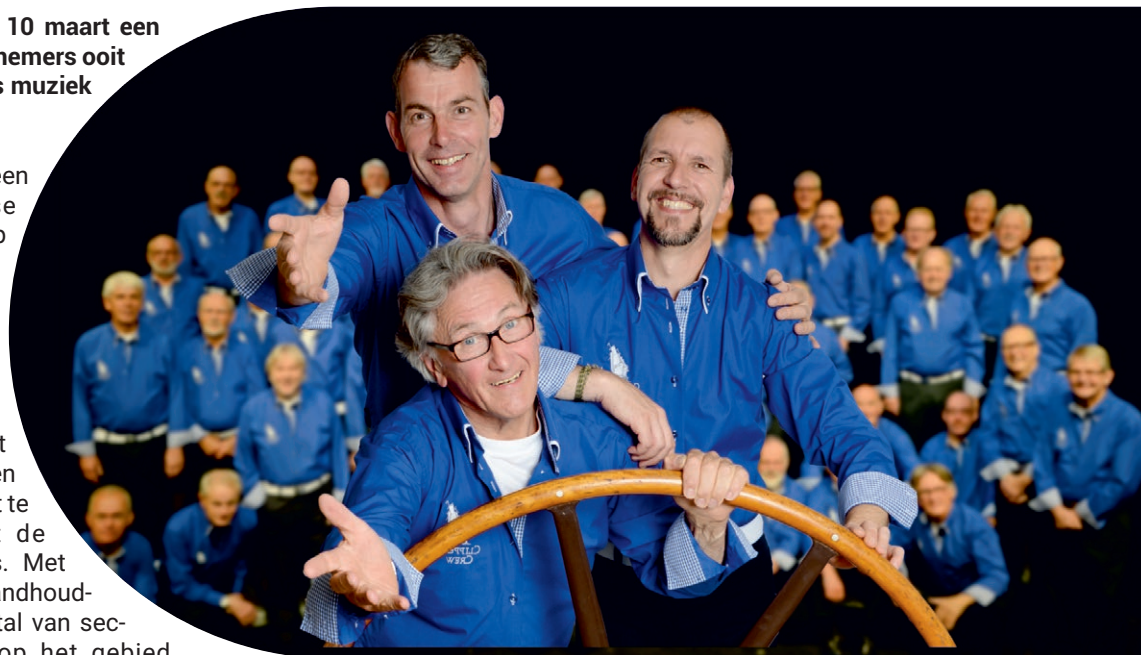
Om 9.30 uur een optreden van de Clipperscrew

ruim 50 standhouders, die tal van sectoren op het gebied van vitaliteit en gezondheid vertegenwoordigen, is het aanbod groter dan ooit. Nieuw is bijvoorbeeld ook het aandeel van de Eerstelijnszorg die op ludieke wijze 'valpreventie' promoot. „Het grote aanbod is tot stand gekomen door een geheel vernieuwde indeling van de beursvloers in de Bouwmeester”,